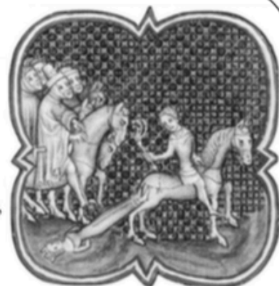
Le supplice de Brunehaut (manuscrit, vers 1375-1380).

L'époque mérovingienne est marquée par la violence, les meurtres et les pillages. Les rois, mais aussi les reines, étaient cruels. Ainsi, la reine Brunehaut qui épousa un petit-fils de Clovis fut accusée d'avoir tué plus de dix rois. Le fils de l'une de ses victimes se vengea : elle fut attachée à la queue d'un cheval qui, dans sa course, lui brisa les os.