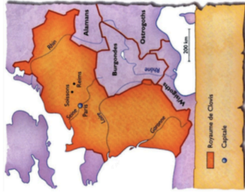
Doc. 2 La Gaule en 511, à la mort de Clovis.