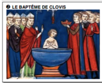
LE BAPTÊME DE CLOVIS