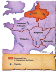
Doc. 1 La Gaule en 481, lorsque Clovis devient roi. 1. Où se situe le royaume des Francs ? 2. Quels sont les autres peuples présents en Gaule ?

1. Observe les documents et réponds aux questions suivantes :