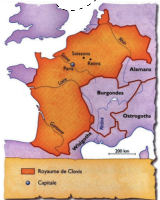
Doc. 1 La Gaule en 481, lorsque Clovis devient roi.