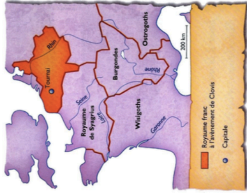
Doc. 1 La Gaule en 481, lorsque Clovis devient roi.