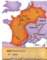
Doc. 2 La Gaule en 511, à la mort de Clovis. 3. Comment a évolué le royaume des Francs ? 4. Quelle en est la capitale ?