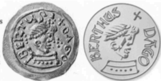
Monnaie mérovingienne représentant Dagobert.

Le roi Dagobert fut l'un des rois les plus brillants et les plus populaires de l'époque mérovingienne. Il fit de nombreuses conquêtes, créa des monastères et se déplaça dans ses territoires pour rendre la justice. Il eut comme principaux conseillers des hommes remarquables comme saint Ouen, saint Didier et surtout saint Éloi comme le dit la chanson !