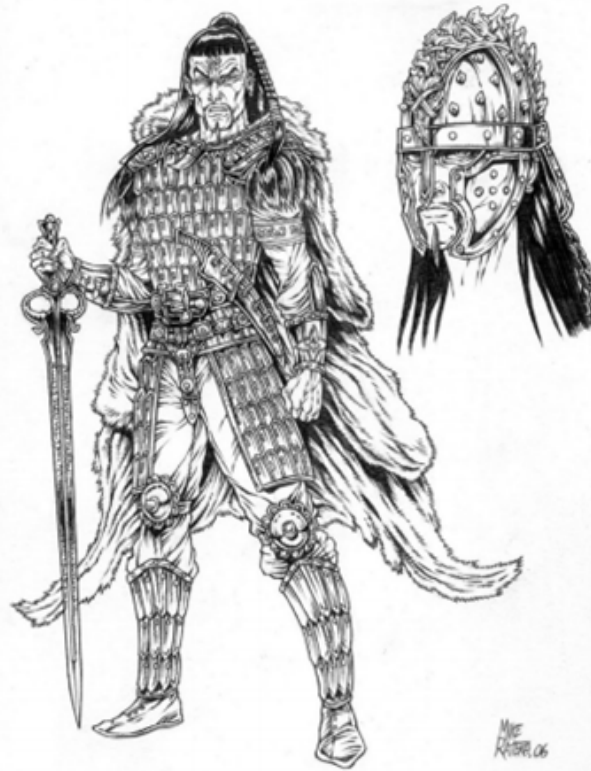
Dessin représentant Attila, le chef des Huns

A partir de 400, les huns , un peuple venu d'Asie, envahissent les territoires barbares pour voler leurs richesses. Conduits par leur chef Attila , ils ne laissent derrière eux que mort et destruction.