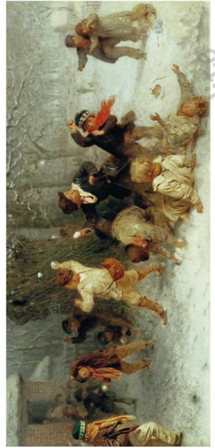
Bataille de boules de neige, tableau du XIX e siècle

En France, en 1882, les députés ont voté une loi qui obligeait les enfants à aller à l'école : fini les batailles de boules de neige toute la journée !