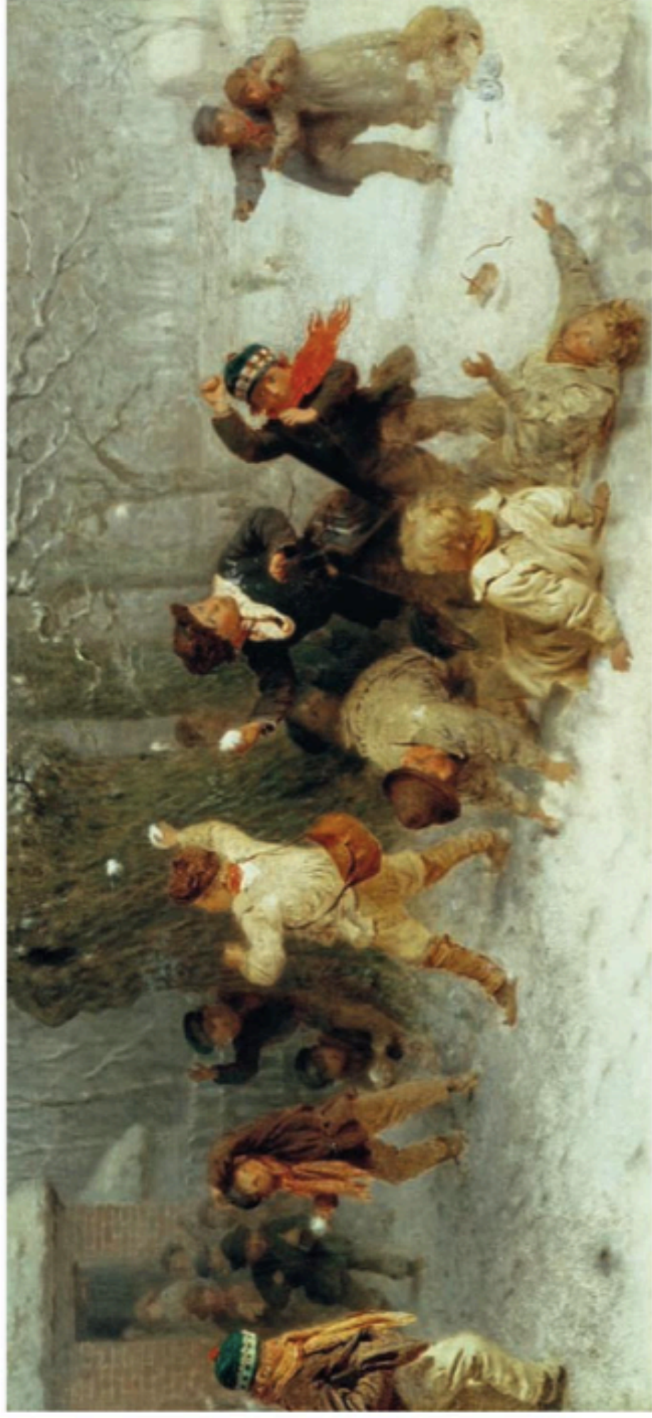
Bataille de boules de neige, tableau du XIX e siècle

En France, en 1882, les députés ont voté une loi qui obligeait les enfants à aller à l'école : fini les batailles de boules de neige toute la journée !