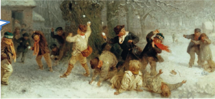
Bataille de boules de neige, tableau du XIX e siècle

En France, en 1882, les députés ont voté une loi qui obligeait les enfants à aller à l'école : fini les batailles de boules de neige toute la journée!