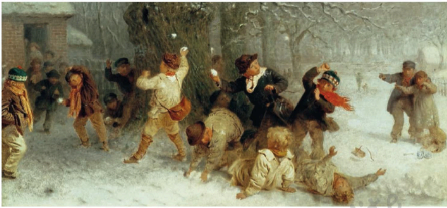
Bataille de boules de neige, tableau du XIX e siècle

En France, en 1882, les députés ont voté une loi qui obligeait les enfants à aller à l'école : fini les batailles de boules de neige toute la journée !