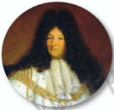
Louis XIV (1643-1715) par Nicolas-René Jollain, XVII e siècle