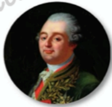
Louis XVI (1774-1792) par Robert Lefèvre, XVIII e siècle