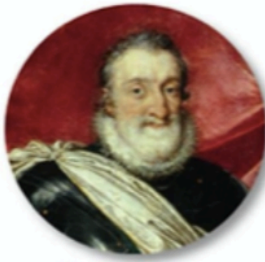
Henri IV (1589-1610) par Frans Pourbus le Jeune, XVII e siècle