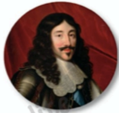
Louis XIII (1610-1643) par Justus Van Egmont, XVII e siècle