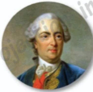
Louis XV (1715-1774) par Louis-Michel van Loo, 1763