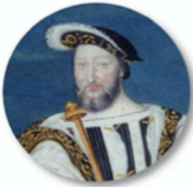
François I er (1515-1547) par François Clouet, vers 1540