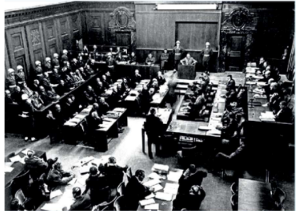
D. Réunion à l'ONU