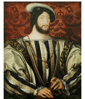
D. Jacques Cartier

D. François Ier vers 1530 par Jean Clouet, huile sur toile, 96 x 74 cm