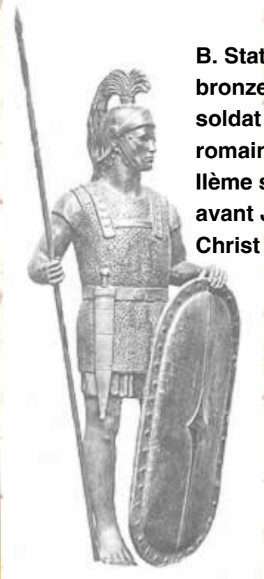
B. Statue en bronze d'un soldat romain, 1 er siècle avant Jésus-Christ