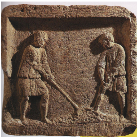
B. Des paysans Gaulois Bas-relief III e siècle

D'après Justin, historien du III e siècle