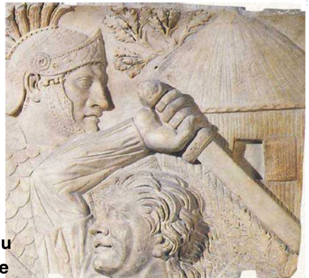
C. Guerrier Gaulois Bas-relief du II e siècle